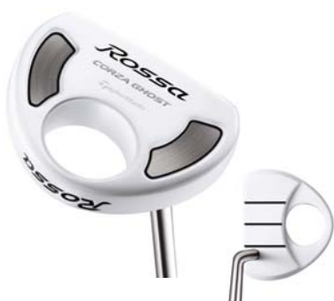
ROSSA® CORZA GHOST AGSI®+ <2010年6月発売予定>