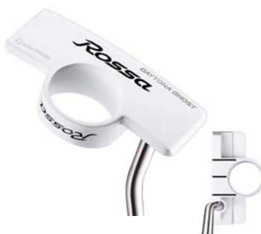
ROSSA® DAYTONA GHOST AGSI®+ <2010年7月発売予定>