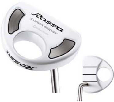
ROSSA® CORZA GHOST AGSI®+

「ROSSA®」パターシリーズが常に提案してきた“アライメント効果”を進化させたヘッドデザインを3種類ラインナップ。ネオマレットタイプの「CORZA」、ブレードタイプの「DAYTONA」、マレットタイプの「FONTANA」の中から好みのヘッドタイプを選択できます。