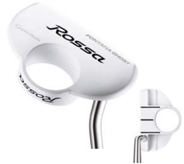
ROSSA® FONTANA GHOST AGSI®+