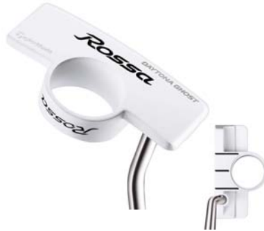
ROSSA® DAYTONA GHOST AGSI®+