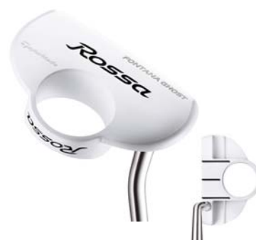
ROSSA® FONTANA GHOST AGSI®+ <2010年7月発売予定>