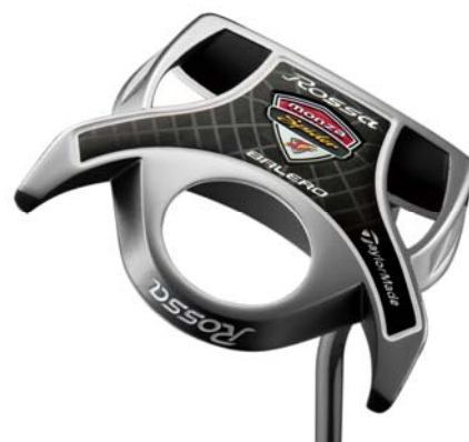
『ROSSA ® MONZA ® SPIDERBALERO AGSI ® s』 (現在発売中)

『ROSSA ® MONZA ® SPIDERBALERO AGSI ® s』では、大きな慣性モーメントと適切な重量配分に加え、アドレス時にボールがカップインするイメージを印象づける新設計のアライメント機能を搭載、正確なアドレスと照準調整をサポートします。フェースインサートにはソフトポリマーを採用した新設計フェースインサート「AGSI ® s」(エージーエスアイ・エス)を搭載。従来の「AGSI ® +」よりソフトな打感を実現します。さらに12本の溝がインパクト時にボールをつかむ様に機能し、無駄なバックspinやスリップを抑制、インパクト直後にスムーズな順回転を実現します。