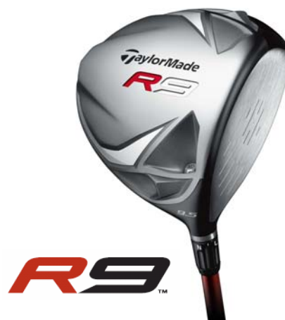
『R9ドライバー』 (現在発売中)

『R9ドライバー』は、ロフト角、ライ角、そしてフェース角までも調整を可能にする全く新しい「Flight Control Technology (フライト・コントロール・テクノロジー)」を搭載。重心可変による弾道調整機能「MWT ® 」との相乗効果により、計 24 通りの弾道調整を可能とし、水平方向で左右最大約 75 ヤードの弾道可変幅を可能にします。シャフト先端に設置された独自の FCT スリーブの位置を変更することで、8 種類のロフト角、ライ角、そしてフェース角の組み合わせの中から適切なポジションへの調整を実現。個々のゴルファーの飛距離を引き出す上で適切なポジションへのチューニングを容易に可能にします。