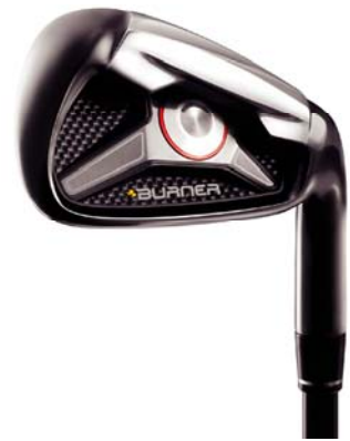
New『BURNER アイアン』 (現在発売中)

New『BURNERアイアン』では番手間の飛距離差に着目、ロングアイアン、ミドルアイアン、ショートアイアンの各セクションで求められる性能を研究し、適切なクラブレングスやヘッド形状などを採用。ロングアイアン(#4、#5)では広いソール幅、厚いトップラインそして長いシャフトレングスによって寛容性と飛距離性能を向上。ミドルアイアン(#6、#7)では薄いフェース、大きいヘッドそして長いシャフトを組み合わせることで、正確性と飛距離性能を両立。そして、ショートアイアン(#8、#9、PW)では薄いトップラインにコンパクトなヘッド、適正なソール幅を採用し、正確性とフィーリングの良さを実現しました。これにより、全ての番手間における飛距離間隔を整えると同時に飛距離性能を向上、それぞれの番手に意味のある飛距離の実現を可能にしました。