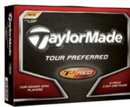
高弾道で最大飛距離へ(3ピース) New『Tour Preferred Red LDP』 〈オープンプライス〉