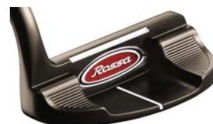
ROSSA® TP Maranello with AGSI®+ by KiaMa