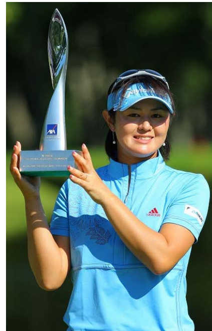
「アクサレディスゴルフトーナメント」で優勝した諸見里しのぶプロ