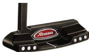
ROSSA® TP Daytona with AGSI®+ by KiaMa