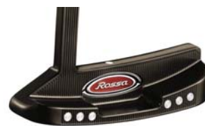
ROSSA® TP Monaco with AGSI®+ by KiaMa