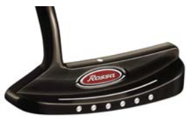
ROSSA® TP Imola with AGSI®+ by KiaMa

世界トップツアープロのあらゆる要求に応じてきたカスタムパターの名匠、KiaMa がプロデュースする『ROSSA® TP with AGSI®+ by KiaMa』コレクションは、ツアープロの要求に対応してきた豊富な知識と経験によって導き出された高いパフォーマンス性を誇るツアーパターです。精密な軟鉄削り出しによる美しいヘッドにステンレススチール製の「AGSI®+」フェースインサートを搭載、プロ・上級者が好む柔らかい打感を実現。さらにクラシックな形状を踏襲しつつも、現代的で洗練されたデザインを実現した同コレクションではブラック IP(イオン・プレーティング)仕上げを採用し、高級感を一層引き立てます。