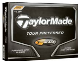
中弾道で最大飛距離へ(4ピース) New『Tour Preferred Black LDP』 〈オープンプライス〉

2006年に発売以来、多くのプロおよび上級者から高い信頼と支持を得ている「Tour Preferred Ball」(以下、TP Ball)をさらに進化させた New「TP Red™ LDP」/「TP Black™ LDP」には新たにボールの空気抵抗を最大限抑制するテーラーメイド独自の空気力学テクノロジー「ロー・ドラッグ・パフォーマンス」を採用、独自のディンプルデザインによりボール表面にバランスよく 360 個のディンプルを配しました。これによりボールへの余分な空気抵抗を大幅に抑制し、飛距離を生み出す上で必要なスピン量の適正範囲をさらに拡大しました。