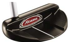
ROSSA® TP Monte Carlo with AGSI®+ by KiaMa