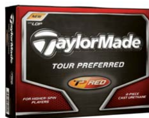
中弾道で最大飛距離へ(4ピース) New『Tour Preferred Red® LDP』 ＜オープンプライス＞

2006年に発売以来、多くのプロおよび上級者から高い信頼と支持を得ている「Tour Preferred Ball」（以下、TP Ball）をさらに進化させた New「TP Red® LDP」/「TP Black® LDP」には新たにボールの空気抵抗を最大限抑制するテーラーメイド独自の空気力学テクノロジー「ロー・ドラッグ・パフォーマンス」を採用、独自のディンプルデザインによりボール表面にバランスよく360個のディンプルを配しました。これによりボールへの余分な空気抵抗を大幅に抑制し、飛距離を生み出す上で必要なスピン量の適正範囲をさらに拡大しました。