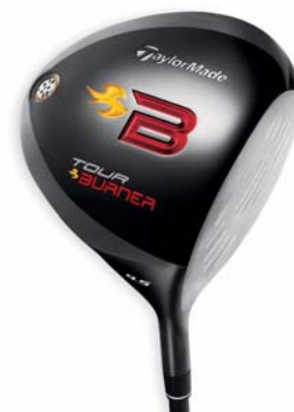
TOUR BURNER TP DRIVER 『TOUR BURNER TP ドライバー』 ＜2008年5月発売＞