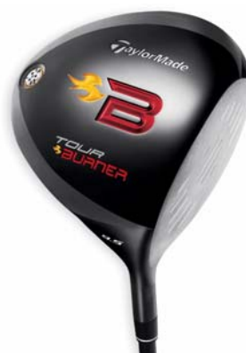
TOUR BURNER DRIVER 『TOUR BURNER ドライバー』 ＜2008年5月発売＞

テーラーメイドの高い技術力が可能にした、小さめのトップクラウン部分と大きめのボトムクラウン部分を合わせた独自の2重クラウン構造「デュアル・クラウン・テクノロジー」を搭載した、斬新なヘッドデザインが特徴のドライバー。ヘッドの重量をソール側に分配することで重心位置の低重心化を実現。有効打点を大きく、重心位置を低く設定することでバックスピンを抑制、高弾道を可能にしました。同シリーズでは「TOUR BURNER ドライバー」に加え、過酷なツアーで戦うプレイヤーにも対応した「TOUR BURNER TP ドライバー」、そして中上級者向けに飛距離性能と操作性を兼備したアイアン「TOUR BURNER アイアン」もラインナップしています。