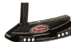
ROSSA® TP Monaco with AGSI®+ by KiaMa