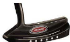
ROSSA® TP Imola with AGSI®+ by KiaMa

世界トップツアープロのあらゆる要求に応じてきたカスタムパターの名匠、KiaMa がプロデュースする『ROSSA® TP with AGSI®+ by KiaMa』コレクションは、ツアープロの要求に対応してきた豊富な知識と経験によって導き出された高いパフォーマンス性を誇るツアーパターです。精密な軟鉄削り出しによる美しいヘッドにステンレススチール製「AGSI®+」フェースインサートを搭載、プロ・上級者が好む柔らかい打感を実現。さらにクラシックな形状を踏襲しつつも、現代的で洗練されたデザインを実現した同コレクションではブラックIP(イオン・プレーティング)仕上げを採用し、高級感を一層引き立てます。