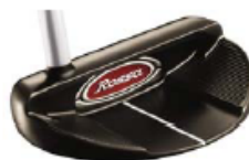
ROSSA® TP Monte Carlo with AGSI®+ by KiaMa