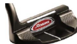
ROSSA® TP Maranello with AGSI®+ by KiaMa