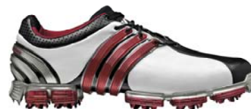
『TOUR360 3.0』 〈現在発売中〉

『TOUR 360 3.0』は360度足全体を包みこむアーチサポートに加え、かかと部に搭載したクリアTPU(ポリウレタン)製サポート素材を一体化した3次元鋳造パーツ、新「360Wrap(サンビャククジュウラップ)」を搭載。これにより、シューレースとの連動性を一層高め、土踏まずから甲部分およびかかと全体へのホールド感とフィット感を実現しました。また、アウトソールには可能な限り薄く設計したことで低重心化を促し、ショット時の安定性を高める「THINTech」を採用。さらに横方向への安定性を向上するアウトソール構造「POWERBAND CHASIS」に10個のクリーツを搭載し、過酷なツアーを戦い抜くツアープロからの要望を満たす高いグリップ力を実現しました。