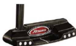
ROSSA® TP Daytona with AGSI®+ by KiaMa