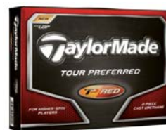
中弾道で最大飛距離へ(4ピース) New『Tour Preferred Red LDP』 〈現在発売中〉

2006年に発売以来、多くのプロおよび上級者から高い信頼と支持を得ている「Tour Preferred Ball」(以下、TP Ball)をさらに進化させたNew『TP Red™ LDP』/『TP Black™ LDP』には新たにボールの空気抵抗力を最大限抑制するテーラーメイド独自の空気力学テクノロジー「ロー・ドラッグ・パフォーマンス」を採用、独自のディンプルデザインによりボール表面にバランスよく360個のディンプルを配しました。これによりボールへの余分な空気抵抗を大幅に抑制し、飛距離を生み出す上で必要なスピン量の適正範囲をさらに拡大しました。