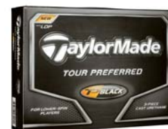
高弾道で最大飛距離へ(3ピース) New『Tour Preferred Black LDP』 〈現在発売中〉